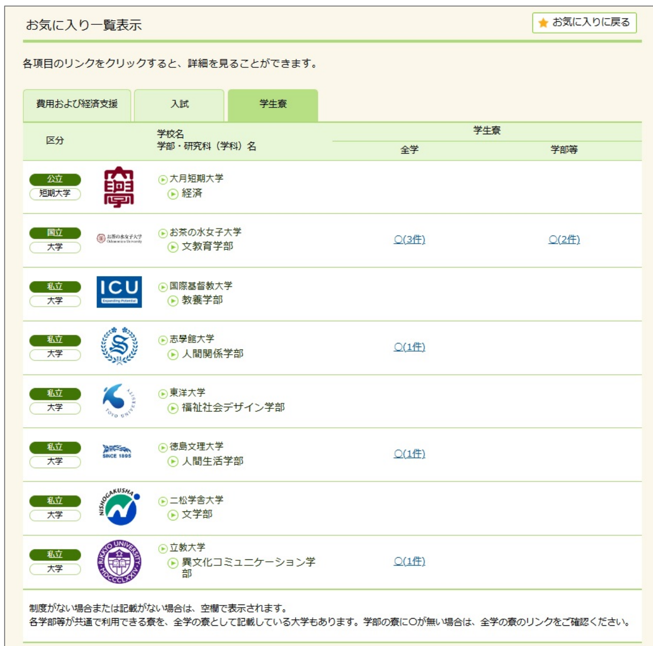
お気に入り一覧表示の例 (学生寮)