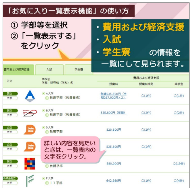
「大学ポートレート(国公立版)の使い方」より