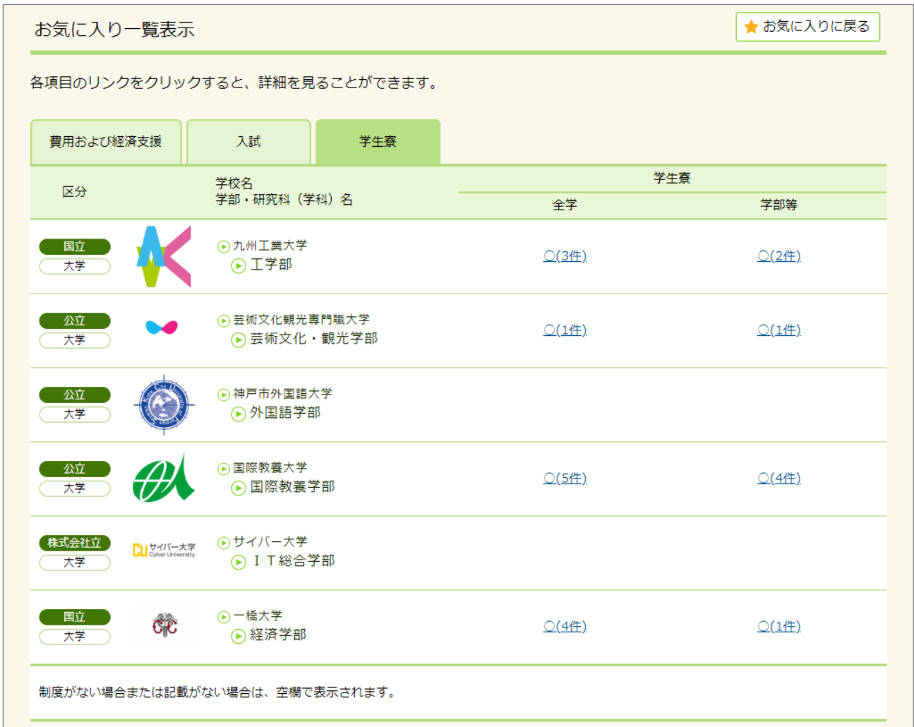
お気に入り一覧表示の例 (学生寮)